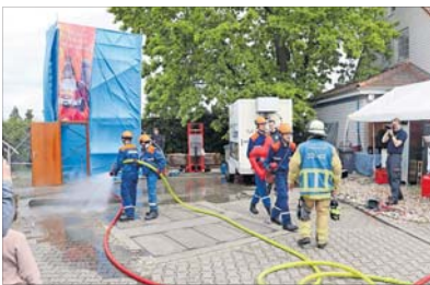
Die Jugendfeuerwehr demonstrierte das Löschen und Bergen bei einem Hausbrand.