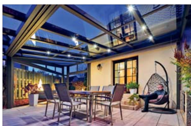
Gut überdacht lässt sich ein Wintergarten bei jedem Wetter genießen.

LAMPERTHEIM. Die 1987 gegründete Firma Karl Arlt verfügt mittlerweile in zweiter Generation über langjährige Erfahrung und Kompetenz. Das freundliche Personal des Familienunternehmens steht gerne für eine fachmännische Beratung und Betreuung seiner Kunden zur Verfügung. Damit dies auch künftig so bleibt, sind weitere Mitarbeiter für eine langfristige Zusammenarbeit mit Zukunftsperspektive willkommen. Die Produktpalette ist ebenso vielfältig wie qualitativ hochwertig: Neben Wintergärten bietet die Firma Karl Arlt auch Aluminium-Konstruktionen für Solaranlagen, Carports oder Kellerüberdachungen an, die nach Maß in eigener Produktion gefertigt werden. Auch Sonnenschutz aller Art sowie Wind- und Fliegen-