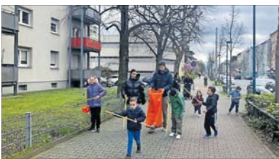
Mit Zangen und Müllsäcken ausgerüstet, machte man sich ans Aufräumen.

RHEINAU. Der Clean-Up auf der Rheinau war ein großer Erfolg und erfreute sich reger Teilnahme. Etwa 150 Teilnehmer machten sich auf den Weg, um die Rheinau von Unrat zu befreien. Organisiert hatten die Aktion das Caritas-Quartierbüro Rheinau, die GBG und das Quartiermanagement Rheinau. Die Chance Bürgerservice gGmbH, das Sonderpädagogische Bildungs- und Beratungszentrum (SBBZ) und die Kita-Gruppen von St. Marien und St. Josef beteiligten sich ebenfalls mit eigenen Gruppen. Vor dem Caritas-Quartierbüro gab es mehrere Infostände