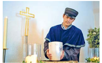
Die Form der Bestattung kann zu Lebzeiten in eigenen Händen liegen.

MANNHEIM/HEIDELBERG. „Niemand setzt sich gerne mit dem eigenen Ableben auseinander. Eine vorherige Planung der Trauerfeier und Beisetzung bringt jedoch für Sie und Ihre Angehörigen viele Vorteile mit sich. Entscheiden Sie selbst über die Bestattungsart, den Ablauf der Trauerfeier und alle Punkte, die für Sie wichtig sind. Entlasten Sie Ihre Angehörigen und sorgen Sie für die Umsetzung Ihrer Vorstellungen. Mit der Vorgabe der Bestattungsart durch Sie und Ihren Anweisungen über die Durchführung der Trauerfeier nehmen Sie alle Entscheidungen Ihren Hinterbliebenen ab und stellen sicher, dass Ihre Wünsche und Vorstellungen auch umgesetzt werden. Sie erhalten eine exakte Aufstellung über das mit Ihnen Besprochene und über die entstehenden Bestattungskosten. Nachdem mit Ihnen alle Details geklärt wurden, erhalten Sie von unserem Be-