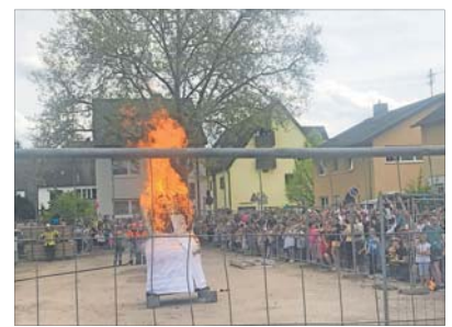
Auf der Vogesenstraße herrschte Hochbetrieb.