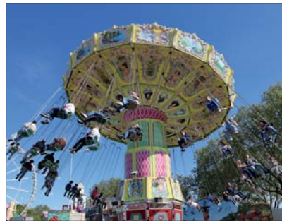
Eine beliebte Attraktion war auch das Kettenkarussell.