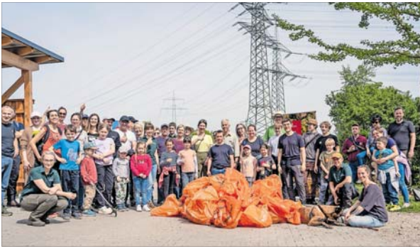
Die Helferzahl war so hoch wie nie, doch auch beim gefundenen Müll wurde ein Rekordstand erreicht.