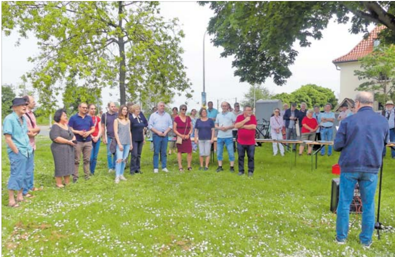
Die traditionelle Seckenheimer Maikundgebung wurde dieses Jahr um weitere Programmpunkte ergänzt.