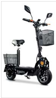
Mit einem E-Scooter sind Senioren auch ohne Auto mobil.

Mobil bleiben mit Elektrofahrzeugen für Senioren